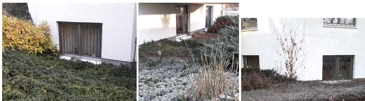
Fenster des zentralen Raumes – linke Seite – Mitte – rechte Seite